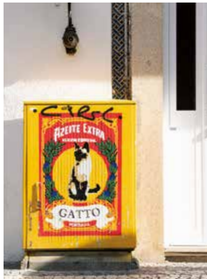
Rua de Cedofeitaの電気ボックス。カタリーナ・ロドリゲス・シニョア・マルシャルというアーティストデュオの作品。