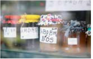
左:ウィンドウにずらりと並ぶジャム。愛すべき手書きラベルは、素朴な筆致。下:たらいを抱えて街を歩く、物売りのエプロンおばさん。

トリエを構えてきた生活の場。手作りジャムを売る店や小さな食品店、荒物屋が残り、アズレージョの壁の古びた一軒家にはギャラリーやサロン・ド・テが隠れている。店を訪ねれば、奥からアーティストがひょっこり現れたり、若きイラストレーターがギャラリーで店番をしていたり。壁を彩るストリートアートもギャラリーに並ぶ絵も、この街ではなんだかほっこり、身近な感じ。それは、作り手が暮らす姿が自然と見えるからなのかもしれない。